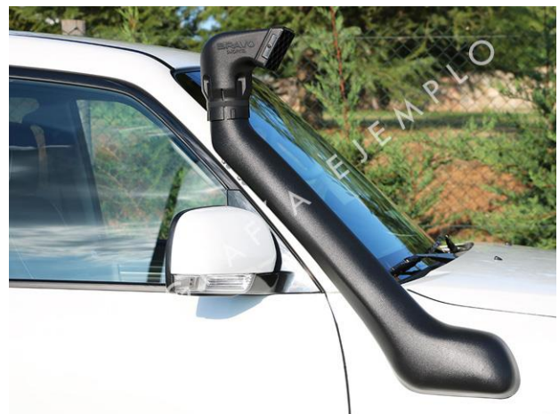
VISTA DEL SNORKEL COMPLETO