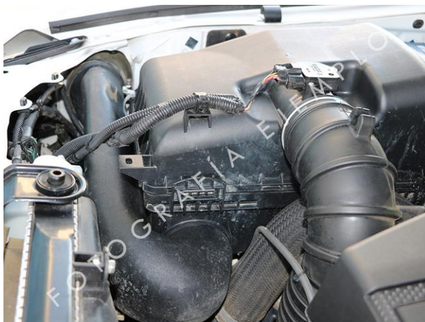
DETALLE UNIÓN SNORKEL CON FILTRO DE AIRE