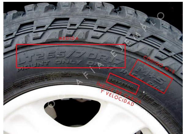
MEDIDA E ÍNDICES DE CARGA Y VELOCIDAD RUEDA